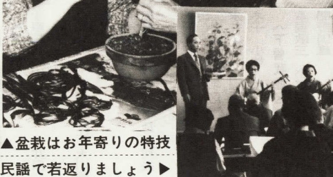
盆裁はお年寄りの特技 民謡で若返りましょう