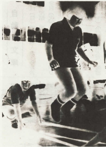
太り過ぎのきみは是非参加しよう

市教育委員会では、泳げない児童を対象に、別表のとおり少年・少女水泳教室を開催します。 次のことに注意してお申し込みください。 ◇申込用紙は、体育課(市役所五階)に用意してありますので、保護者承認印押印の上、直接申し込んでください。 ◇申し込みは、5月15日から