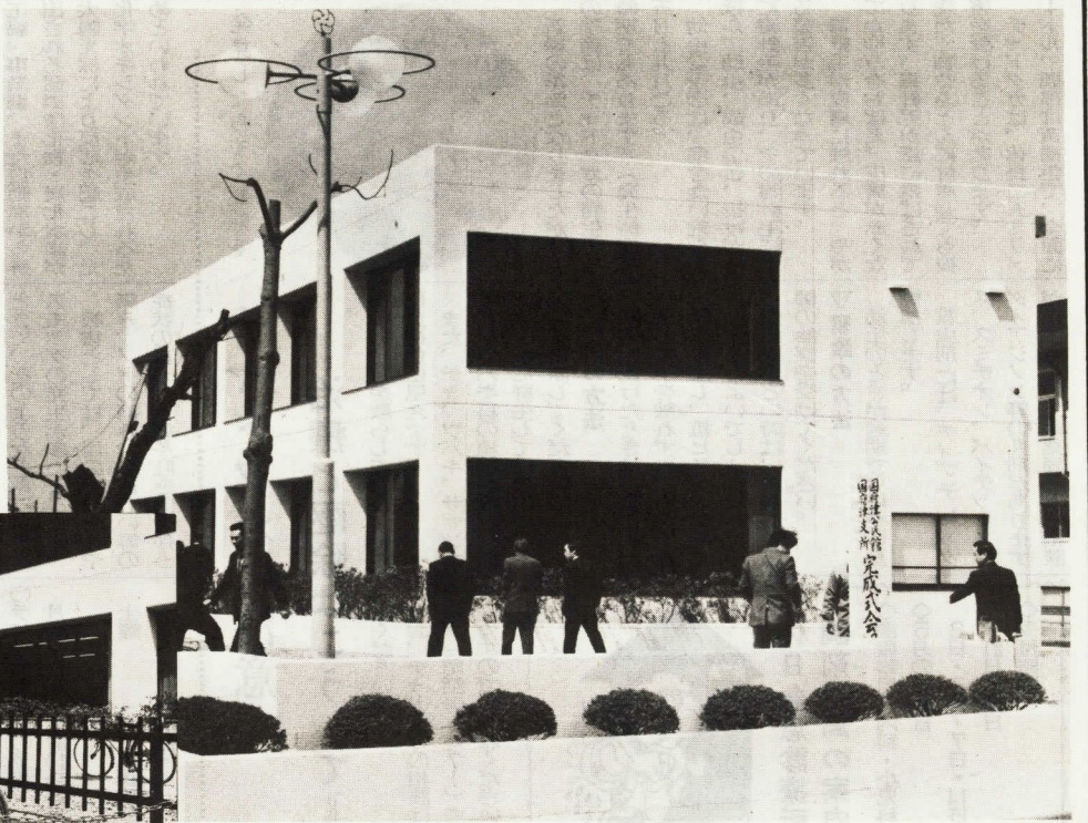
身障者の方も利用できるようスロープもあり、市庁舎に似ている公民館の全景