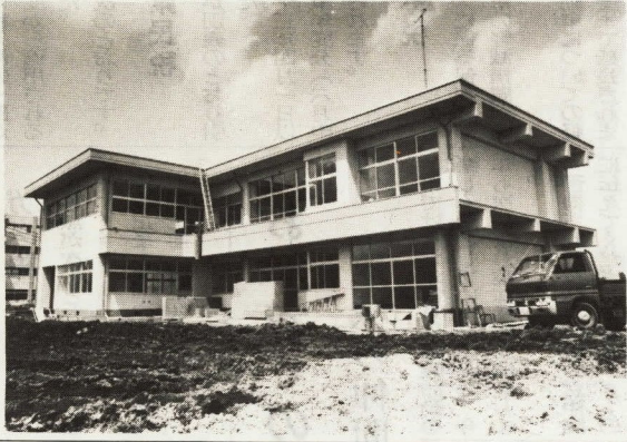
園舎も5月中には完成して移転する

本市6番目の市立幼稚園として報徳幼稚園が開園し、四月十日に四歳児四十人が元気に入園しました。園舎は、現在建設中のため報徳小学校の教室を借りて開園しましたが、5月中には鉄筋工