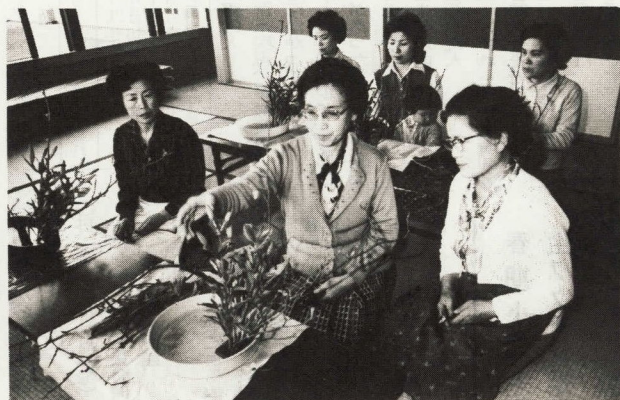
2階の和室は、華道や茶道の練習などに利用される