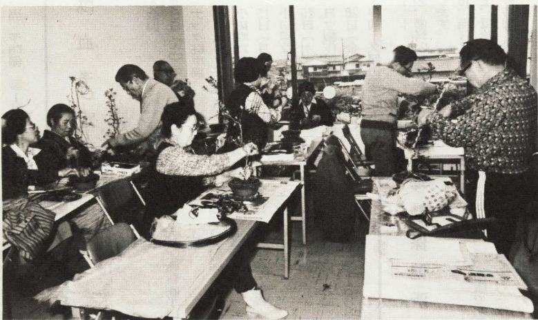
早速、盆栽教室でにぎわう2階の実習室

開館とともに利用申込みが相次ぎ、常駐する公民館職員もうれしい悲鳴。会議・学習・レクリエーションの場として、婦人会や老人クラブなど各種団体の利用者が夜遅くまで明かりがともることが多い。「交通の便がちよっとねえ...でもモダンな施設で仲間と一緒に勉強できて楽しいわ」とグループ学習で来館されたあるお母さんの感想。 国府津公民館では講座や学級などいろいろな事業を企画・開設しますので、その際はみなさんどうぞお越しを。