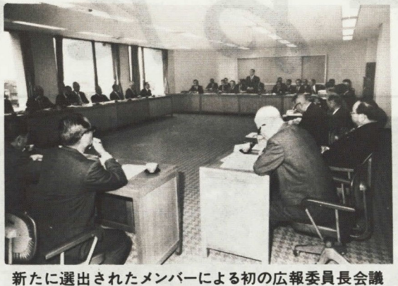
新たに選出されたメンバーによる初の広報委員長会議

このほど、各地区自治会の本年度役員改選が終わり、自治会長二百三十人が決まりました。市では、これらの自治会長を四月一日付けで地区嘱託員と広報委員に、またあわせて災害発生通報責任者に委嘱しました。