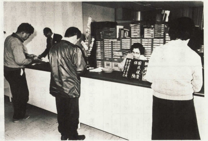
支所も1階に併設されている