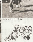
まだまだ、これから.....