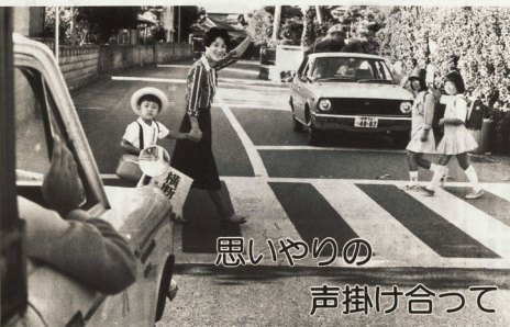
思いやりの声掛け合って

今年1～8月の交通事故発生状況は、前年同月同士の比較で、死者は1.6人、重傷者は3.6人、軽傷者は446.4人、発生件数は37.4件と減少傾向にある。これは、交通安全の意識の高まりによるものと見られる。