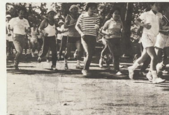
マイペースでの走り方が、この会のルール