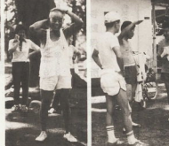
汗が老化の防止に.....