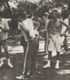
走り終わっての満足感が気持ちいい