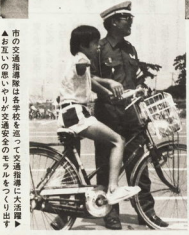
市役所交通安全課は、交通安全を推進するために、交通安全の意識を高めるための活動を行っています。交通安全の意識を高めるための活動を行っています。