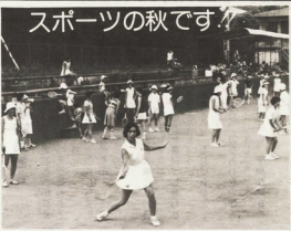
スポーツの秋です。十月はスポーツの季節、この月を中心にいろいろな盛り出しのスポーツやレクリエーションの行事が盛り込まれます。