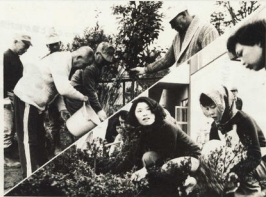
自治会やPTAが町の緑化の推進役として活躍している

緑豊かなまちづくりが、市民の生活の質を高め、市況の活性化を促すことにつながります。市民の手で緑の街づくりを推進するため、公園緑地課では、市民の緑化の相談を受け付けています。