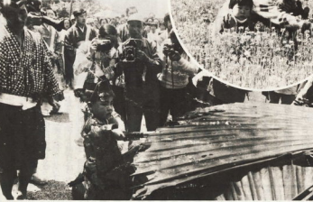
曾我兄弟の「食後きまり」北々張文に...