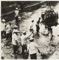
河川に捨てられたゴミが思わぬ災害の原因に

河川に捨てられたゴミが思わぬ災害の原因に 河川に捨てられたゴミが思わぬ災害の原因に 河川に捨てられたゴミが思わぬ災害の原因に