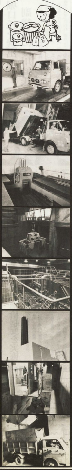
1.ゴミ収集車で自動収集 2.ゴミは1ミリの細かい粉じん 3.粗ごみは焼却して 4.ゴミをトラックから運ぶ 5.焼却炉で完全燃焼 6.灰は再処理される 7.灰は再処理される 8.灰は再処理される