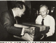
村松さんは、お花買に今年も市長に得意の歌を