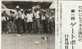
お年寄りに人気のあるスポーツは、今やゲートボール