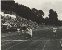
この日上競技場も全天候型に生まれ変わる(工事請負契約可決)