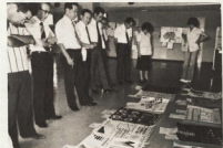
553点の沢山の力作を審査する先生方も一苦労

児童・生徒の夏休みの力作多数 児童・生徒の力作を審査する先生方も一苦労 児童・生徒の力作を審査する先生方も一苦労