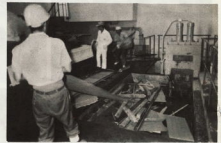
利用の場合は、直接清掃工場へ持ち込んでください