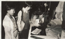
仲間たちが作った創意工夫の品々を見学する子どもたち

伊豆教育会館のホールに、児童の力作が展示されている。創意工夫展と科学展は、11月10日(日)と11月11日(月)の2日間、伊豆教育会館(伊豆市)で開催される。展示品は、児童の創意工夫の品々や、科学の不思議な現象を再現した品々など、力作が数多く展示される。展示時間は、10日(日)午前9時～午後5時、11日(月)午前9時～午後5時。入場料は、小学生以下無料、中学生以下100円、高校生以下200円、大人300円。問い合わせは、伊豆教育会館(電話0476-22-1111)まで。