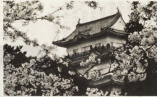
昭和54・5 天守閣完成祝いの駅前の大平門