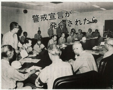
警戒宣言が発令されたら