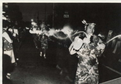
新しい夏まつり行事のちようちん踊り