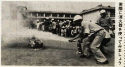
実際に消火活動に従事してみよう

火が出たら119番に連絡したからといって、消防車がすぐに来てくれるわけではありません。交通渋滞などもあります。火元で消防車到着する前に消火活動が重要です。