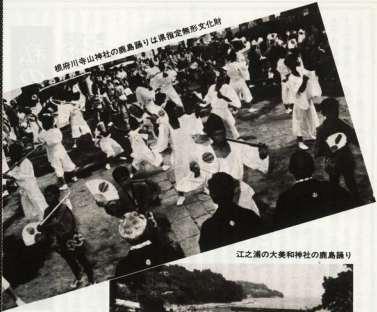
江之浦の大英和神社の鹿島踊り