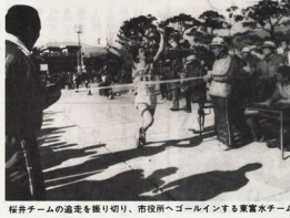
relay team members crossing a finish line, cheered on by spectators.