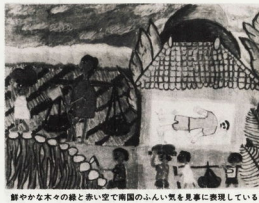
朝やがた木々の緑と赤い空で南国のふんい気を見事に表現している