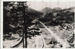
横嶺の富士山から遠望1号線の諸橋方面を望む(昭和10年代)

◆国民年金 ◆福祉年金受給者及び家族の方は、申告書を提出し、申告金(納税)を提出し、みずから申告して納税期間を満了します。 ◆国民年金 ◆福祉年金受給者及び家族の方は、申告書を提出し、申告金(納税)を提出し、みずから申告して納税期間を満了します。 ◆国民年金 ◆福祉年金受給者及び家族の方は、申告書を提出し、申告金(納税)を提出し、みずから申告して納税期間を満了します。 ◆国民年金 ◆福祉年金受給者及び家族の方は、申告書を提出し、申告金(納税)を提出し、みずから申告して納税期間を満了します。