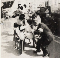
パンダも登場しありがとう(昨年10月の町振興会)

昭和55年度共同募金の結果、本市の各町会、公民館、自治会等から、総額13,967,485円が寄せられた。