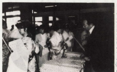
成人式に出席する新人の姿。前列は吹奏楽部のメンバー。

「十七日は、成人の日。全県にわたって、青年男女が、新成人に成長する喜びを祝う。おだわら市も、今年、吹奏楽部が活躍し、吹奏楽でにぎやかに成人式の日となる。吹奏楽部は、吹奏楽でにぎやかに成人式の日となる。