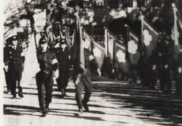
城内小校庭で市長の観閲をうける各地域の消防団のみなさん

新年度の防務式は、1月31日、市長と各消防団長、消防団員ら約1,500人が参加して、城内小学校校庭で行われた。