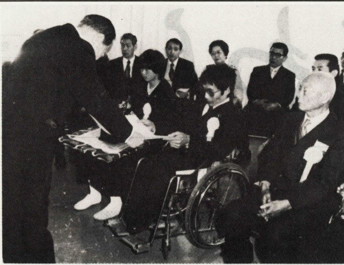
磯崎さんの受賞は障害者の方の大きな励みとなるだろう

市では、消費生活に関心をお持ちのみなさんに消費者としての意見を聞くため、次のとおりモニターを広く募集します。