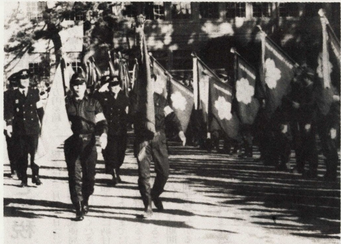
城内小校庭で市長の観閲を受ける各地域の消防団のみなさん

新春恒例の消防始式は、一月十一日、晴天に恵まれ城内小学校とお堀端通りを会場に盛大に挙行されました。