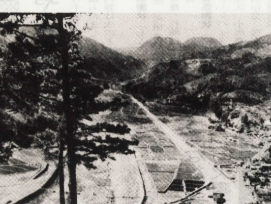
板橋の富士山から国道1号線の箱根方面を望む(昭10年代)

あなた、市県民税の申告をお済みになりましたか。福祉年金は、費用の全額が国の負担によって支給される年金であるため、毎年一回所得調査が行われます。これによって、一定の額以上の所得があったり、他の年金を受けていたりすると支給を停止される場合があります。そして、この調査により向こう一年間の福祉年金が受けられるかどうかが決まります。