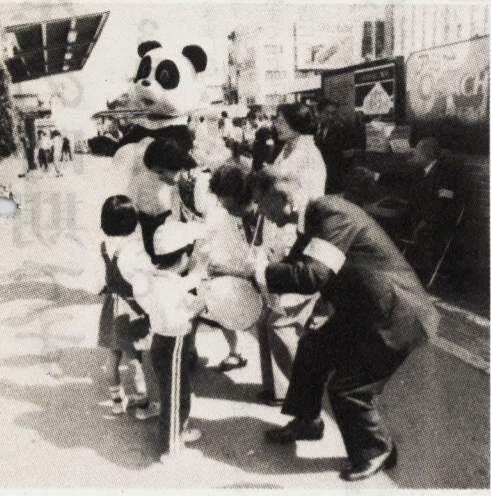
パンダも登場しありがとう(昨年10月の街頭募金)

昨年十月に行いました赤い羽根による一般募金は、目標額を上回る一千四百六十三万二千八百八十円(達成率一〇七・七)もの寄付金が寄せられました。