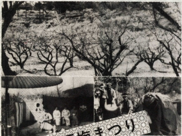
上が辻村農園の梅・下は曾我の舞獅子舞と野だて

小田原梅まつり 期間 二月一日～三月一日 会場 曾我梅林・城址公園 野だて 二月十一日(祝日)