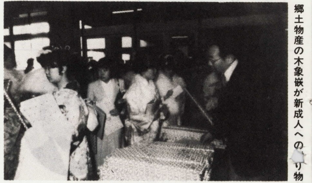
郷土産物の木象嵌が新成人へのさり物