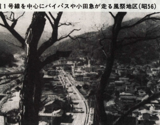
国道1号線を中心にバイパスや小田急が走る風祭地区(昭56)