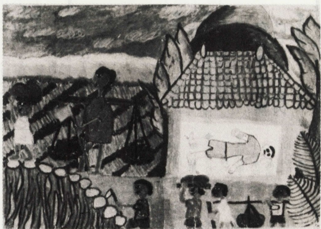
鮮やかな木々の緑と赤い空で南国のふんい気を見事に表現している

「全しんやたれ、ブルにとびこんで、そのままおぼれてしまふ友、ふき出る血で、友の服を消そうとする者、それらの友を見捨ててにげられるのらうか。ちがう。だが、しかたがないのだ。友よ、ゆるしてくれ。」そう書いてあります。自分が、にげられてせいはいっぱいだったのでしょ。一人の力では、どうすることも出来ないのです。どんなにつらく、悲しかったでしょうか。