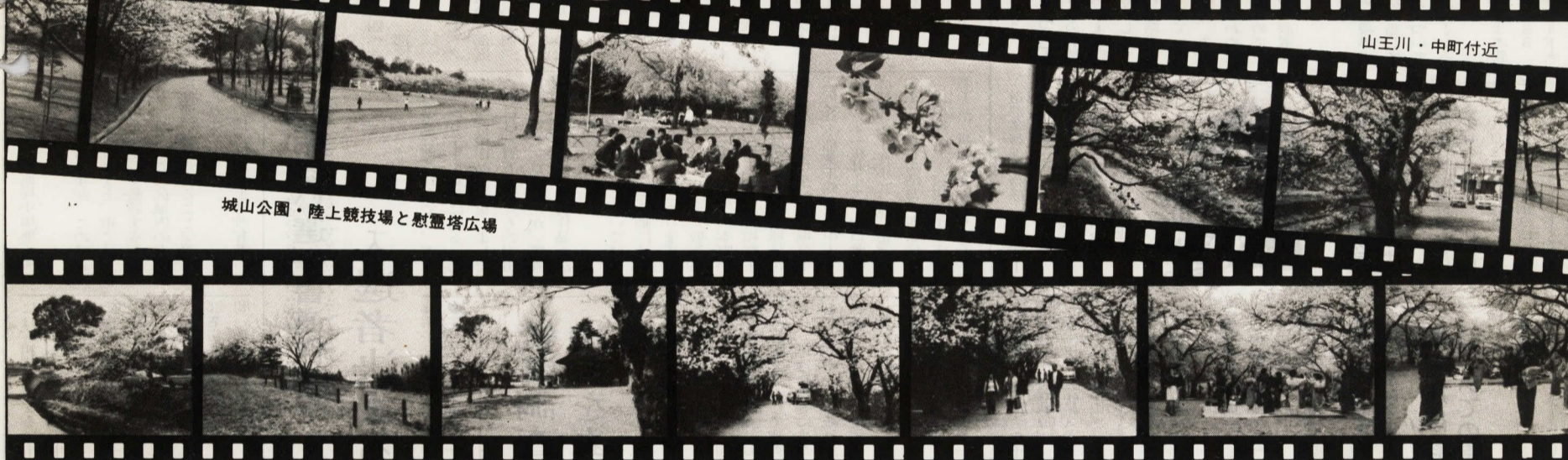
久野配水池 矢作・春光院 沼代・桜の馬場