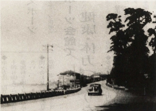
バイパスもなく交通量に隔世の感がある(昭和初期)

郷土文化館では歴史研究会を次(史跡をたずねる会) 郷土文化館では歴史研究会を次(史跡をたずねる会) 郷土文化館では歴史研究会を次(史跡をたずねる会)