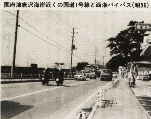
市制40周年 小田原の今昔 ⑤