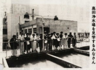
高田浄水場の様子もみらん