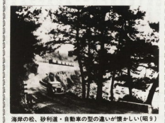
海岸の松、砂利道・自動車道の違いが懐かしい(昭9)