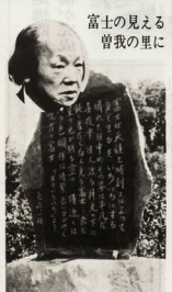
富士の見える 曾我の里に

尾崎一雄文学碑の起立式が、5月16日、大塚市大塚町で挙行政。尾崎一雄の曾我の里に、文学碑が設置される。式には、市長、市議会議員、市民ら約100人が参加した。文学碑は、尾崎一雄の「富士の見える曾我の里」を題材として制作された。碑文には、尾崎一雄の業績と、大塚市の発展を祈る言葉が刻まれている。式後の懇話会では、尾崎一雄の文学について、尾崎一雄の曾孫、尾崎信太郎氏の話があった。