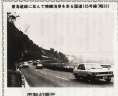
東海道線に並んで機織海岸を走る国道155号線(昭56)

市制40周年 小田原の今昔 (一) 市制40周年 小田原の今昔 (二) 市制40周年 小田原の今昔 (三) 市制40周年 小田原の今昔