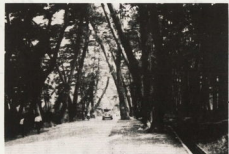
旧型のバス1台が並ぶだけの旧株道の面影も国道 (昭-18)