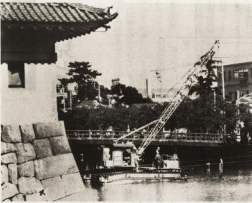
昨年着手した市制40周年記念事業の「お水の浄化」は今年度完了する

市では、市民のみならず本市の財政がどのようになっているかを理解していただくために、毎年六月と十一月に財政状況を公表しています。 今回は、昭和五十五年度の下半期分の執行状況について公表しました。その概要は次に掲げたグラフや表のとおりです。詳しい内容については、市役所財政課(電話031311で公表資料を閲覧されるか、お尋ねになつて下さい。