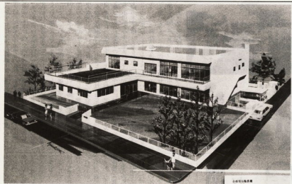
蓮正寺地区に移転新築する梅香園の完成予想図と平面図