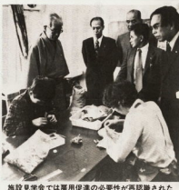
施設見学会で雇用促進の必要性が再認識された