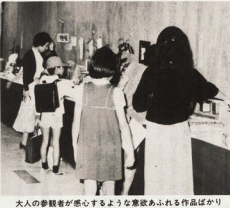
大人の參觀者が感心するような意欲あふれる作品ばかり

●第3回の創意工夫展と科学展が、市立小田原小学校(以下、小田小)で、10月19日、20日の二日間、開校50周年記念行事として、大々的に行われ、大成功を収めた。 ●創意工夫展は、10月19日、20日の二日間、開校50周年記念行事として、大々的に行われ、大成功を収めた。 ●科学展は、10月19日、20日の二日間、開校50周年記念行事として、大々的に行われ、大成功を収めた。 ●創意工夫展は、10月19日、20日の二日間、開校50周年記念行事として、大々的に行われ、大成功を収めた。 ●科学展は、10月19日、20日の二日間、開校50周年記念行事として、大々的に行われ、大成功を収めた。