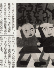
交通安全ポスターコンクール