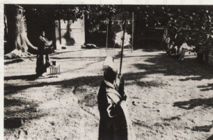
明年1月7日に白髭神社(小船669番地)境内で行われる春射祭の様子