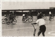
自転車の貸出用ができてから利用者も多くなった

酒匂川左岸サイクリング場は、家族で楽しむのに最適な場所です。美しい自然環境の中で、健康的な運動ができます。自転車の貸出サービスも充実しています。ぜひ、ご家族でご利用ください。