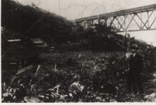
丹那トンネルが開通し東海道本線となった白赤川鉄橋(昭-15)