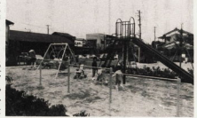
みなで仲間（大切）に利用してください

中町は、この町の中核として、児童公園の整備を進めています。40番目の児童公園は、焼却跡地に建設されています。 公園の概要： ● 面積：約10,000坪 ● 設備：遊具、遊歩道、花壇など ● 完成予定：5月 お問い合わせ先：公園課 電話：〇二二-〇〇〇〇