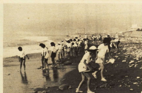
海の珍しい今市のおまぢらは打ち寄せる波に大はしゃぎ

本市は姉妹市結成六周年の記念として、今年夏に訪日した今市市(オランダ)のスポーツ少年団を、本市に招待し、今市市と交流を深めようとする。今市市は、オランダの中部にあり、人口約二万五千人、面積約五百平方キロメートル、人口密度が低い。今市市は、オランダの中部にあり、人口約二万五千人、面積約五百平方キロメートル、人口密度が低い。今市市は、オランダの中部にあり、人口約二万五千人、面積約五百平方キロメートル、人口密度が低い。