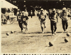
健康な若き心と体からモットーにいよいよまでお祝いで