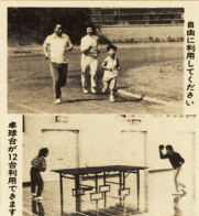
本場から12日前用います

本市が新設したスポーツ施設は、準備が完了し、10月10日より正式に開放される。この施設は、市民の健康増進とスポーツの普及に資するため、開放される。開放される施設は、陸上競技場、庭球場、スポーツツ会館である。開放時間は、午前7時から午後7時までの間である。開放される施設は、市民の健康増進とスポーツの普及に資するため、開放される。開放される施設は、市民の健康増進とスポーツの普及に資するため、開放される。