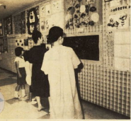
昨年の障害者愛護作品展に続いて力作を

障害者の生活状況や感受性、個性を表現し、社会への理解を促すことを目的として、障害者作品展を開催します。出品作品を募集します。出品作品は、絵画、工芸、陶芸、書道、写真、音楽、ダンス、パフォーマンスなどです。募集期間は、九月十七日から十月二十五日までです。お問い合わせは、障害者福祉課。