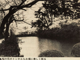
▲桜の花のトンネルもお堀に美しく映る

本年度から町や口自由で電話による送付が可能な方のために、ミニファクスを市の福祉課と社会福祉センターに設置しましたので、是非ご利用ください。 設置場所の電話番号は、次とおりです。 福祉課 電話 2146 社会福祉センター 電話 2148