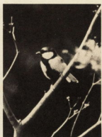
小鳥のみぎずりにも耳を