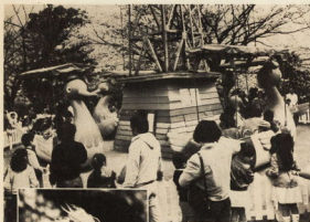
▲飾り物に集まるにも長い列！