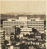
今年度で全館完成する市立病院

市は、昭和五十九年度から、みなぎに關する地方税法が改正され、市税おだわら正課金は次のとおりです。 ①所得控除額引上げ ②法人市民税 ③自動車税 ④軽自動車税