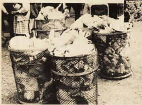
▲ゴミは何と10トンも出ました