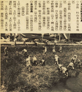
河川の清掃も自治会活動の一つとして行われています