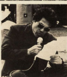
▲花よりカラオケです