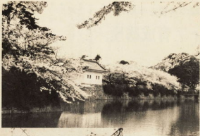
▲開の桜の園にまたれた開くら