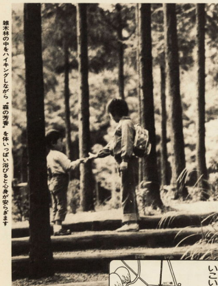
森林の中で、インゲンなる、蕨の葉を採りに行く。おだわら自然観察会。