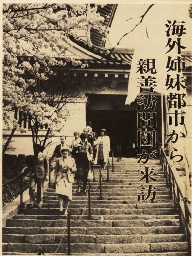
チュラビスタ市 Chula Vista

アメリカ西海岸カリフォルニア「レモンの王国」と呼ばれている州の最南部、メキシコとの国境近くにあり、人口8万人余り、面積51.1平方キロの市です。気候が温暖で、19世紀末から柑橘(かんきつ)の産地として栄え、一時は