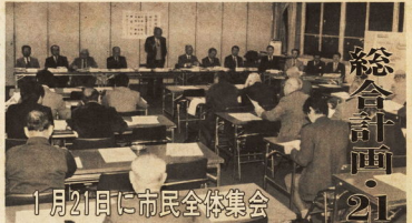
1月21日に市民全体集会

調査の結果、本市は前年より人口は約九千四百七十八人、増加した。これは、前年より九千四百七十八人、増加した。これは、前年より九千四百七十八人、増加した。