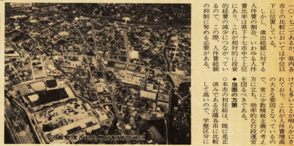
市役所本庁舎の上空から見た風景

民間活力の導入は、市民参加の行を促進するために必要である。従って、組織の簡素化は、市民参加の行を促進するために必要である。従って、組織の簡素化は、市民参加の行を促進するために必要である。従って、組織の簡素化は、市民参加の行を促進するために必要である。