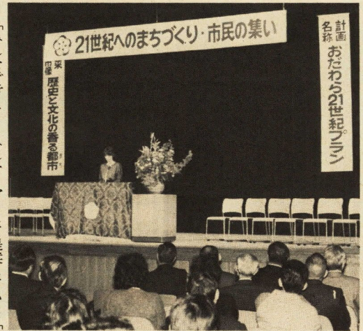
市民の方による意見発表も行われました