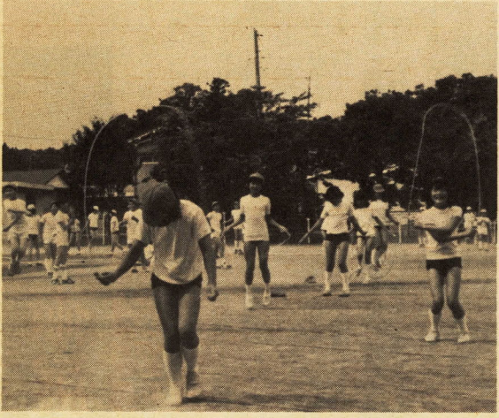
みんなで一緒に(なわとび大会)

私たちの早川小学校の窓か ら南西の方を見ると、秀吉の 小田原攻めで有名な一夜城の 石垣山があり、その前面は、 みかん畑が広がり、秋には黄 色いみかんの実が目を惹きま せてくれます。南は小田原漁 港があり、朝早くから魚のせ りが行われています。東には、 早川の急流が音をたてて流れ て、六月になると大ぜいのつ 開校年月日 明治六年五月五日 学級・児童数 十二学級 四百十五人 教職員数 十八人