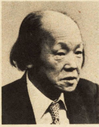
私小説や随筆に数々の名作を残した郷土の作家・故尾崎