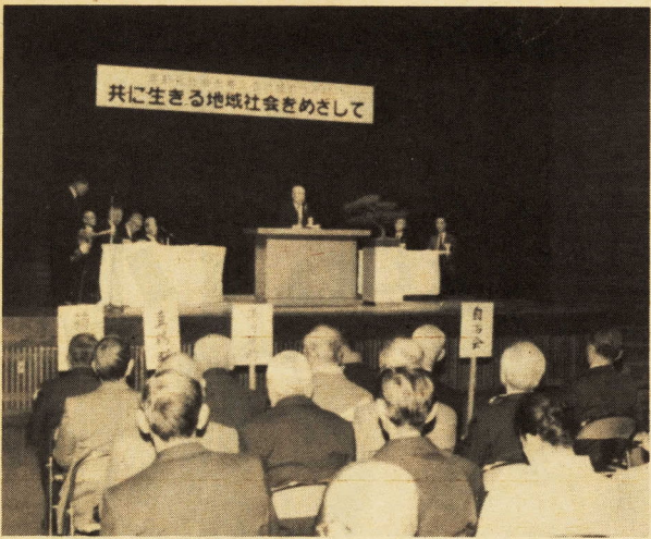
真剣に老後をどう生きるかみんなで考えました

社会人口の高齢化が急速に進んでいる中、各世代にわたる人々が一堂に集い、生き生きとした発言を通じて、高齢化社会を考えることを目的に、当日は、小田原市、下郡三十二日十九日、市民会館小ホールにおいて、「高齢化社会を考える西湘地区の集い」が、年団体など約三百人が参加し