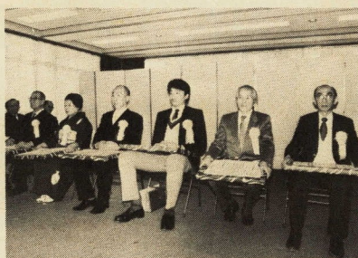
ほう賞を受けられたみなさん

がほう賞を受けられました。 このほう賞制度は、寄付金を基金として昭和五十年十月に設置されたもので、本市に関する学術、文化、教育、福祉等について特別な研究又は功績のあった個人、団体に贈られるもので今年度で十回目となりました。 今回受賞された方々と功績は次のとおりです。(敬称略)