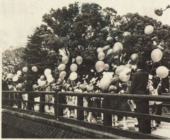
入学記念行事の「花の種をつけた風船上げ」