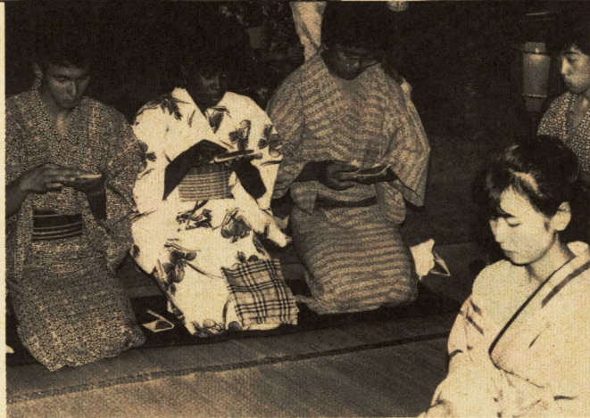
▲茶の湯の接待に緊張気味