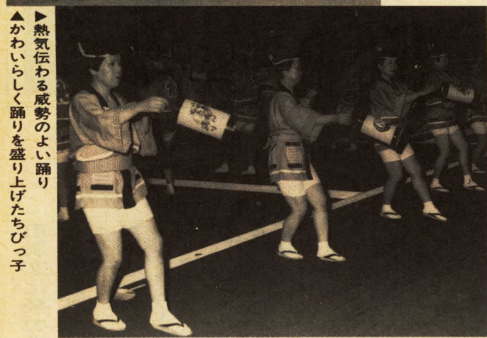
▶熱気伝わる威勢のよい踊り ▲かわいらしく踊りを盛り上げたちびっ子