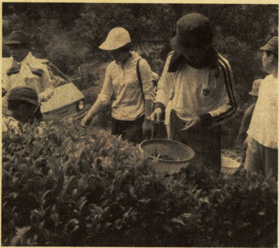
全校児童による茶つみ行事

去年七十歳になった、ぼくたちの学校は、三年前に、木の造の旧校舎から、鉄骨建ての新校舎に変わりました。四階