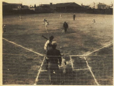
▲ソフトボールの観戦試合(結果は1勝1敗)

大阪府岸和田市と、共に城下町で人口も同程度、そして地質も非常に似ているところがあることで、昭和四十二年に青少年交流の観戦交流を実施することになりました。 以降五年まで、ソフトボール、水球、サッカー等、青少年が互いに交流を図ってきました。その後十年間は諸事情により中断していましたが、本年一月、両市青少年問題協議会の話し合いで再開することになり、その第一陣として今回の岸和田市訪問となりました。