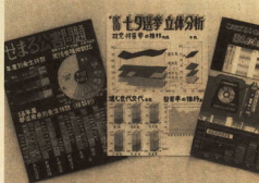
工夫を凝らした作品が数多くありました