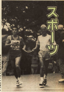
昨年の日本盲人ラン大会から