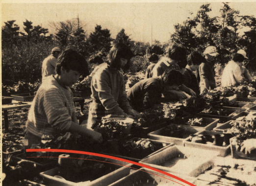
緑化センターで寄せ植え講習会に参加する市民たち

センターの職員の手導を受けて寄せ植えに取り組みました。各自所持した植木鉢や木箱に、種類のアジサイ、プリムラ、ポリアキなど、桜系二種類を使い、組み合わせて苦心しながらも、かわいい寄せ植えを作りました。