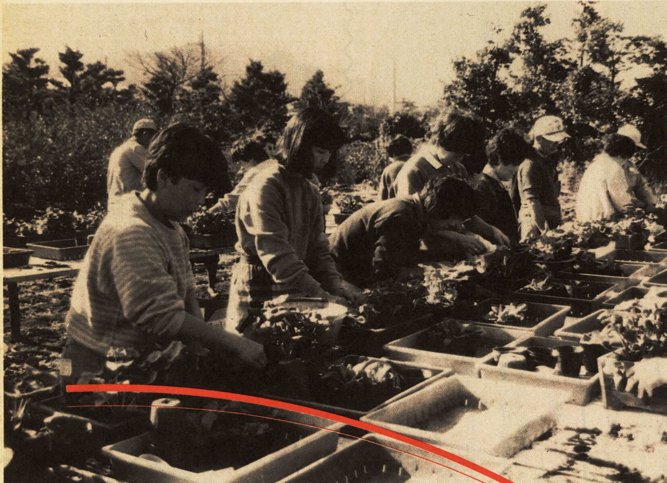
額にうっすらと汗が—真剣に取り組み参加者たち(緑化センターで)