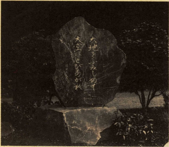
校庭にある「大地をふみしめて……」の石碑

私たちの片浦中学校は、眼下に広がる相模湾、三浦半島や房総半島まで眺めることのできる高台にあり、後ろにはミカン畑を背負っています。 この八月には二代目の校舎が鉄骨四階建てで改築されました。直線百メートルのコースがとれるグラウンドも整備作業が始まり、とてもきれいな学校に生まれ変わりつつあります。 開校年月日 昭和二十二年五月五日 学級・生徒数 三学級百五人 教職員数 十二人