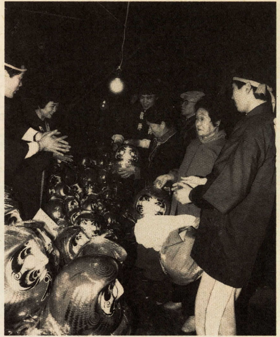
師走の風物詩・飯泉観音のだるま市

眼科 1月3日 受付時間 午前9時30分～11時30分 午後1時～3時30分 ※受付時間は守ってください。所在地 城内1-22(商工会議所の奥) ☎4600 注意 必ず「保険証」を持参してください。協力 小田原医師会・小田原薬剤師会 担当 健康係 ☎331838