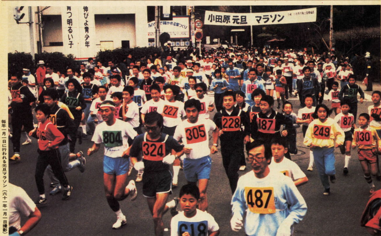
昭和六十一年一月一日にわたれ元元ランサン(六十一年一月一日撮影)