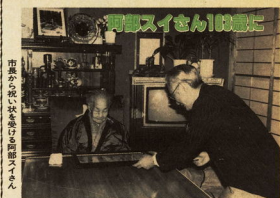
お祝いに市長が訪問

今回は、市役所から八百四十名、市内の小中学校から選挙し、子どものうた、きれいな書作、選挙啓発、交通、明るい選挙の歌として市所、探偵、どの部類を展覧する。3月28日(土)から3月31日(日)まで、明るい選挙の歌、子どもうた、きれいな書作、選挙啓発、交通、明るい選挙の歌として市所、探偵、どの部類を展覧する。