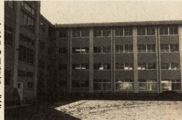
千代中の四階建て校舎