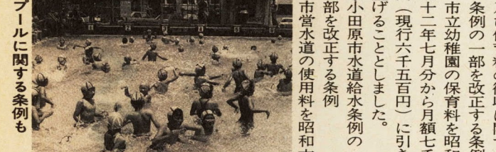
モダンな豊川保育園の新園舎(3月15日撮影)

豊川保育園は、昭和三十二年に木造平屋建てとして建築されたが、老朽化が進んでいましたので、この度旧園舎から北西へ約百メートル離れた成田六五八番地へ改築しました。 新園舎の概要は、次のとおりです。 ▽鉄筋コンクリート造一階建て ▽延べ面積二五八・五〇平方メートル ▽一階：事務室・乳児室・調理室など ▽二階：保育室・遊戯室 ▽定員六十人 ※この施設の建設費の一部は、年金積立元金に融資を受けました。