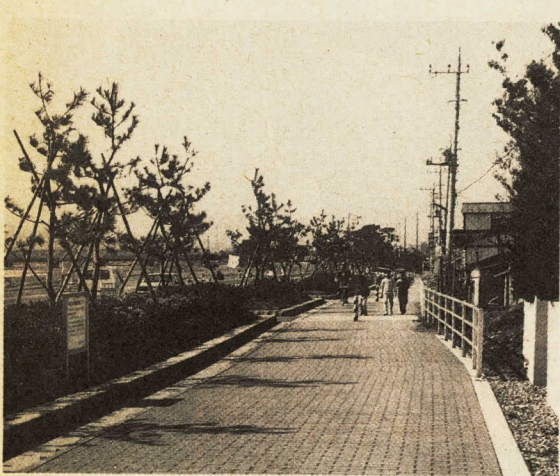
緑豊かな新しい憩いの場です