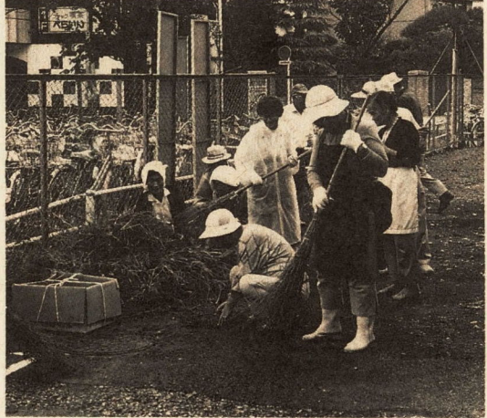
安心してボランティア活動を

★保障の内容は… 奉仕活動中、指導者などの過失により行事参加者やその他の第三者の身体、財物に損害賠償を請求されるケースが多々見られるようになってまいりました。これではせっかく伸び始めた善意の芽を摘んでしまふことになるかねません。