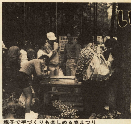
親子で手づくりも楽しめる春まつり

ご存知ですか 母子家庭等への手当 父のいない家庭の児童の福祉増進を図ることを目的として、十八歳未満の児童を監護している母、または母に代わって養育している方に対して、手当を支給する制度です。ただし、公的年金を受けられる方や、所得金額が一定以上ある児童 ①父が引き続き一年以上遺棄されている児童 ②父が死亡した児童 ③父が障害(重度)の状態にある児童 ④父の生死が明らかでない児童 ⑤父が引き続き一年以上遺棄されている児童 上の方は支給されません。 ○対象となる児童 ①父が離婚した児童 ②父が死亡した児童 ③父が障害(重度)の状態にある児童 ④父の生死が明らかでない児童 ⑤父が引き続き一年以上遺棄されている児童 ○特別児童扶養手当 ①対象となる児童 ②対象となる児童 ③対象となる児童 ④対象となる児童 ⑤対象となる児童 ○支給対象者 ①未婚の母から生まれた児童(認知された児童を除く) ②何らかの事情で父母以外の人に養育されている児童 ③小田原市母子家庭等児童手当に支給されている児童 ○支給額 一人につき月額千五百円(児童二人まで支給) ○問い合わせ 児童課 ☎331454