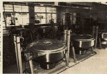
国府津小の給食調理場

新学期を前に、白鷗中学校、千代中学校の校舎増築、国府津小学校の給食調理場の建設がそれぞれ完成しましたので、みなさんに施設の主な内容を紹介いたします。 ◆白鷗中学校 校舎 鉄骨造平家建て二階建て 三三・三三平方メートル 技術科教室 (金工室・木工室) ◆千代中学校 校舎 鉄筋コンクリート造四階建て 一〇八・八九平方メートル 普通教室二教室 ◆国府津小学校 給食調理場 鉄骨鉄筋コンクリート造平家建て一部三階建て 七二・〇五平方メートル