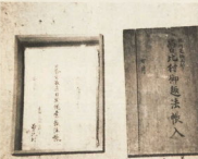
病気の激しかった曾村は金次第の直接指揮……曾村の遺法(住法)様(昭和十年文氏)