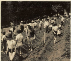
収穫を楽しむになえを植えます