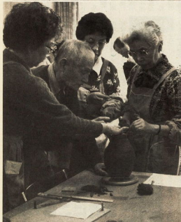
同好の仲間と仲良く陶芸を(社会福祉センターで)

高齢化社会とは、一般に、保健、医療、教育、文化、人口に占める老人人口、居住環境、都市施設など、五歳以上の割合が相対的に分けておられる。高齢化社会とは、一般に、保健、医療、教育、文化、人口に占める老人人口、居住環境、都市施設など、五歳以上の割合が相対的に分けておられる。