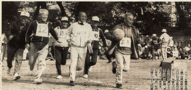
元気な老後への準備が確かな老後の生活スタイル

六十五歳以上が人口の半分の割合を占める六十五歳以上の高齢化社会の到来は、市民生活に大きな影響を及ぼす。本市は、高齢化社会の到来に備え、高齢者の生活の質を向上させるためのまちづくりを進めている。高齢者の生活の質を向上させるためには、高齢者の生活の質を向上させるためのまちづくりを進めている。高齢者の生活の質を向上させるためには、高齢者の生活の質を向上させるためのまちづくりを進めている。