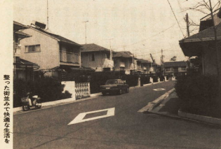
整った街並みで快適な生活を

地域に適した きめ細かな内容を 地区計画とは、身近な生活環境を改善し、住みよい環境を創出するための取り組みです。地域の特色や課題に合わせて、きめ細かなルールを設定し、住民の協力を得て進めます。