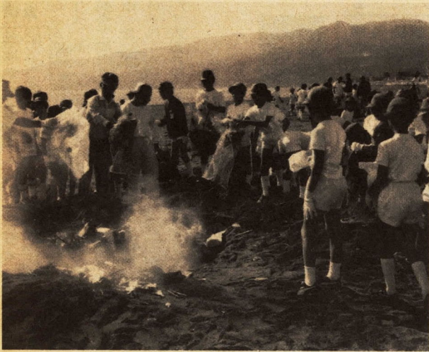
全校のみんなで海岸の清掃を

私たちの山王小学校は、教室の窓を開けると、目の前に太平洋に続く相模湾が広がり、青々とした海の色を染みませてくださいるところにあります。全校児童数が三百三十四人の小さな学校です。