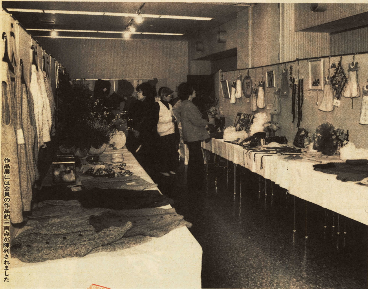
作品展には会員の作品約三百点が陳列されました