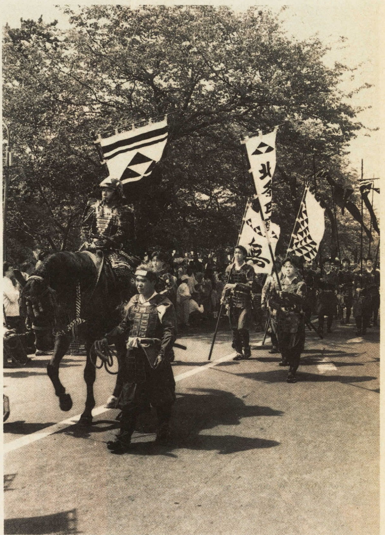
今年も城下に勇壮な時代絵巻が(昨年の北條五代祭りから)

◆申込方法 所定の募集申込書に必要事項を記入し、カラーの全身写真一枚と白黒の上半身写真(五センチ×五センチ)二枚を添付して三月三十一日(木)までに、小田原市観光協会(〒250小田原市城内一の二十二小田原商工会館内)へお送りください ◆審査・発表 審査は、四月十五日(金)午後六時から中央公民館で行われ、結果の発表と表彰が行われます。なお、審査は観光協会が委嘱する審査員が行います