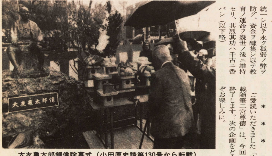
大友亀太郎銅像除幕式 (小田原史談第130号から転載)

開削と道路、橋梁の造成に全力を尽くした。この業績は、今日札幌市で高く評価され、大友塚、大友公園などにその名を残し、札幌開拓の先駆者として銅像も建立されている。明治三年、職を辞した尊徳は、その後若松(茨城県)島根県、山梨県の難村復興に当たっている。明治七年、帰郷して地元の副区長、戸長を歴任、同十四年より四期にわたって県会議員となった。この間、千代小学校の基本財産造成には報徳仕法をもって、その財政基盤を確立した。当時、千代小学校が名門校と謳われたのは尊徳の尽力にもよるのである。彼は、明治三十年、六十四歳で没するが、その葬儀には全校児童が参列し、次の弔詞を捧げている。公ノ生ルルヤ天命ヲ帯ビテ而シテ来ル、校舍ノ配置ヲ