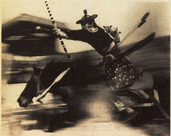
流鏝馬(写真)のあった2月11日は約12万人が

今月七日、梅まつりが閉幕しましたが、暖冬で梅の開花が早かったためか、観梅客の出足がよく、曾我梅林と城址公園合わせて八十三万九千人と、これまでの最高を記録しました。また、流鏝馬(やぶさめ)の行われた先月十一日は十一万八千五百人と、一日の人出では過去最高を記録しました。