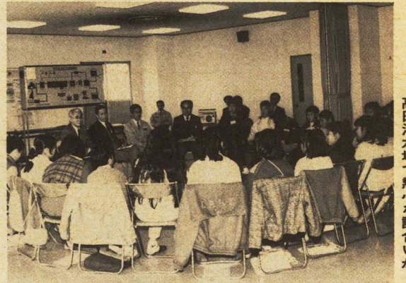
高田浄水場で熱心な話し合いが