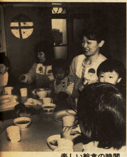
楽しい給食の時間

今日の社会経済の変化は、家庭にも及んでいます。男女雇用機会均等法の制定により、働く婦人が一層増えたり、親と一緒に生活しない核家族化が進む一方、離婚の増加による単親家族も増えてきました。 このような家族構成の変化によって、乳幼児の置かれた状況も変わってきました。乳幼児教育への関心が高まり、集団保育を期待する家庭も多くなってきています。 乳幼児の健全育成に大きな役割を果たしているのが保育所と幼稚園です。 保育所と幼稚園は、それぞれ乳幼児教育について相互補完的な役割を果たしています。下の表のように相違点がありますが、児童を健やかに育てようという点では同じです。保育所は、昭和二十二年に