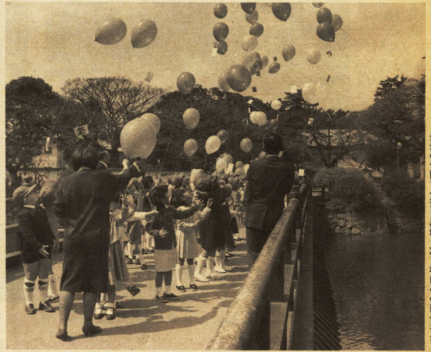
先生の合図で一斉に風船を放す城内小の新一年生

この日、小田原城跡にある城内小学校では、新入生六十一人が、入学の記念に、学校前のお堀に架かっている学橋(まなびばし)から色とりどりの風船を一齐に大空に放ちました。新入生たちは、歓声を上げながら空に吸い込まれていく風船を見えなくなるまで見送っていました。続いて、「コイの稚魚を橋の上からお堀に放し、「元気に育つてね」と魚に声を掛けていました。