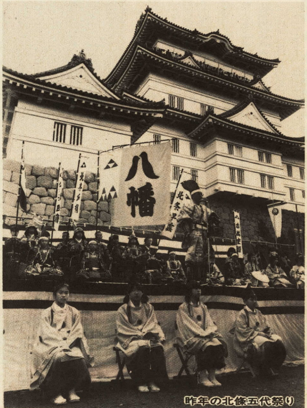
昨年の北條五代祭り

従来の「お城まつり」は、昨年「小田原北條五代祭り」に呼び名を改め、五月三日・四日・五日の三日間、小田原城を中心に盛大に開催されます。 ◎五月三日(憲法記念日)