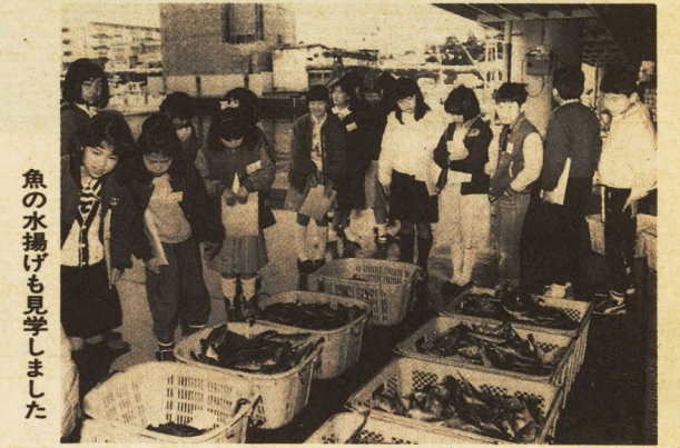
魚の水揚げも見学しました

三月二十九日(火)、公共施設見学会と市長と話し合う会が開かれ、小学校4年生から六年生まで二十二人が参加しました。