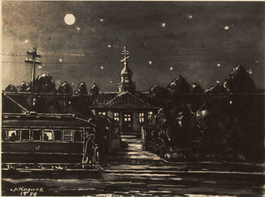
教会の夜景。大正時代は前が電車通りだった

ハリストとは、「キリスト」のロシア語的発音で、ハリスト正教会とはロシア正教会のこと。 小田原にこの教会が創立されたのは明治十年代で、当時の入信者は、三十二人ぐらいたったという記録がある。 その後、東京駿河台のニコライ堂の管理下に置かれ、聖務は東京から派遣された神父によって行われていたという。当時の教区は、小田原を中心とした周辺地域に及び、大正初期には、在籍信徒は約六百人を数えたという。 私は、明治四十年、この教会の真ん前の家で生まれたが、そのころ、町の人はこの教会