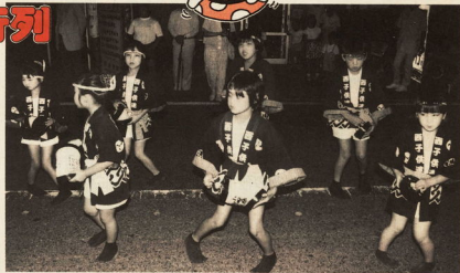
かわいらしい子供の踊りに大きな拍手が

城下町小田原夏まつり前歩のメインイベント「小田原ちょうちん踊り行列」が、七月十三日夜行われ、ちびっ子からお年寄りまで二千団体七百五十人がお堀端通り、お城通りを踊り歩きました。 あいにくの梅雨寒で小雨もちらつきましたが、梅雨空を吹き飛ばそうとみなは威勢のよい掛け声に合わせ、手にしたちょうちんをリズムミカルに開いたり折り畳んだりしながら踊っていました。沿道を埋めた約四千人の見物客からは、声援や拍手が盛んに送られていました。