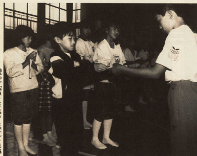
姉妹都市のきずな強める交流を