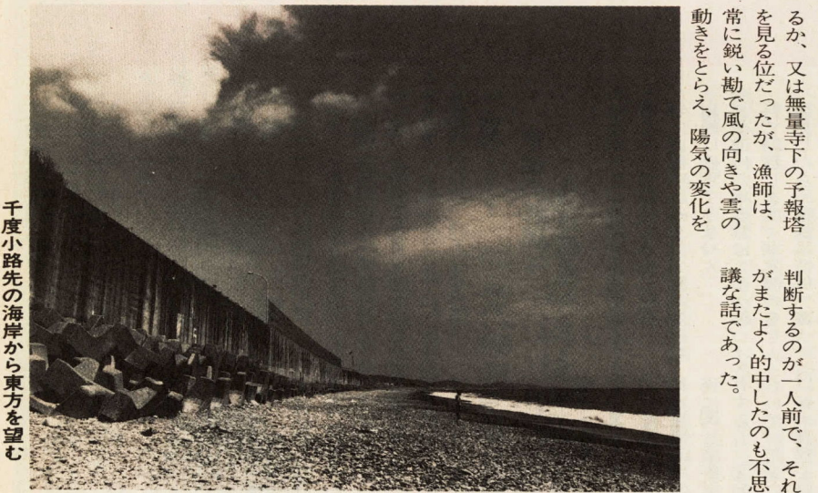
千度小路先の海岸から東方を望む

上がるもので、しかも、三分位で消失するという不思議な雲だという。 そこで、この古老の話を聞きながら私は、何度も描き直してまとめたのが、この想像画である。 私自身またこの奇怪な天然現象を見た経験がないので自信のないままこの絵を見せたところ、古老は思いもよらず「よーがすよー。そう、こんな風でしたよー。よく描けましたよー」と褒めてくれたが私自身は、それでもなお半信半疑で納得のいかないままである。 大正中頃は、まだラジオすらなく天気予報は、新聞を見