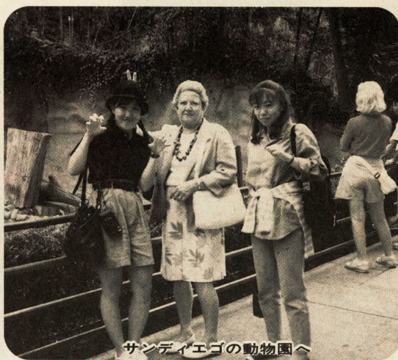
サンディエゴの動物園へ

見るか、又は無量寺下の予報塔を見る位だったが、漁師は、常に鋭い勘で風の向きや雲の動きをとらえ、陽気の変化を判断するのが一人前で、それがまたよく的中したのも不思議な話であった。