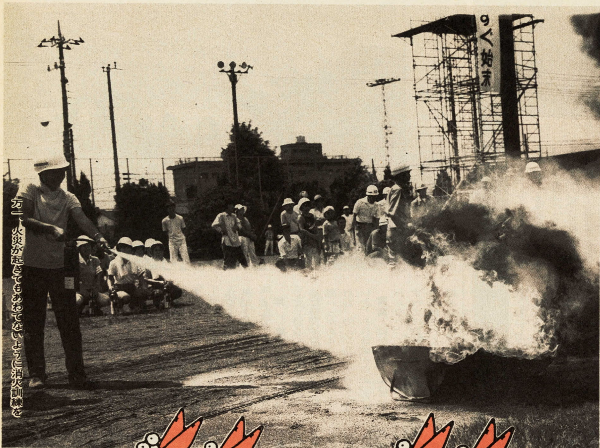
万一、火災が起きてもおおわてないように消火訓練を

しの給食の訓練などを行いました。そして、電気やガスの復旧訓練や放水訓練、高層建物からのけが人救出訓練を熱心に見守っていました。災害は、日ごろからの心掛けが大切です。みなさんの家庭や職場でも防災について話し合っ、万一の場合に備えましょう。