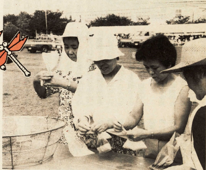
訓練、米を炊く訓練、調理する調理方法を覚えよう

夏休みに、小学校五年生と六年生、六十人が参加して農業体験学習が行われました。市内の花、野菜、稲、ナシ、ミカン、乳牛、養鶏、養蜂などをしていいる農家に泊まり込んで実際に農作業を手伝いました。この体験学習をとおして日ごろ知ることのできない農業の苦労と喜びに触れ、たくさんのお話を学んだことでしょう。