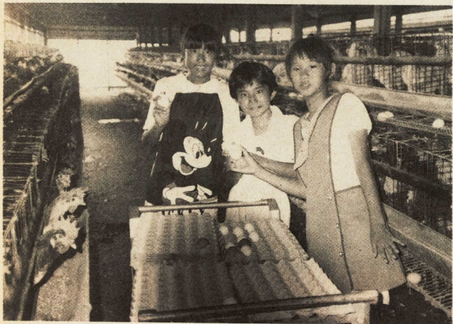
卵を集めるのも初めての体験です

夏休みに、小学校五年生と六年生、六十人が参加して農業体験学習が行われました。市内の花、野菜、稲、ナシ、ミカン、乳牛、養鶏、養蜂などをしていいる農家に泊まり込んで実際に農作業を手伝いました。この体験学習をとおして日ごろ知ることのできない農業の苦労と喜びに触れ、たくさんのお話を学んだことでしょう。