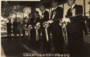
開業式がさかまてテープカット

箱根外輪山のみもと、久野にある市の緑化センター。この温室の中では、シラネやシャコバサボテン、サウラン、ホクシヤなどが色とりどりに咲いています。外は、木枯らしが吹きつけるこの季節、温室の中に入ると冬から春一變にして季節が移ります。 みなさんも是非お出かけください。