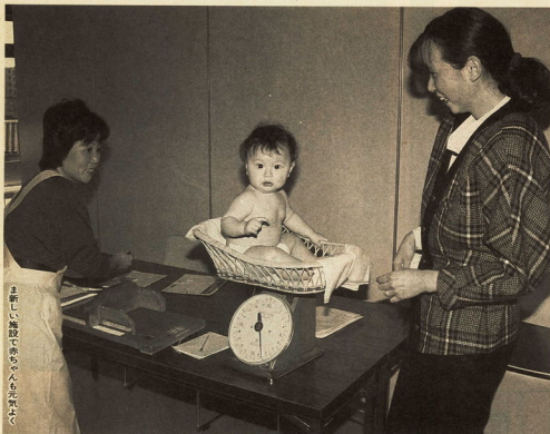
まっ新しい施設で赤ちゃんと元気に