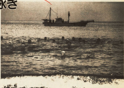
明け方の冷たい水の中を先陣に泳ぎました

恒例の「新春初泳ぎ」が元旦の朝御幸の浜海岸で行われ、小田原水協会員約二十五人が泳に入り初泳ぎをしました。 四十三回目を迎える今年は、例年に比べ暖かかったもののあいにく曇り空で、初日の出は見ませんでした。 それでも海岸に集まったたくさんの人たちが見守る中、午前七時少し前に冷たい海の中へ入ると全員で輪になり、元気がいっぱい大きな声掛け合いました。 泳ぎ終わった後、用難されたき叉で体を暖めている姿には、新しい年を気持ちよくスタートできた喜びが溢れかたがあらわれていました。