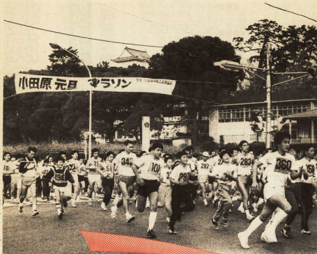
新たな気持ちでスタートです

新年の行事として市民のみならず、親しまれている「元旦マラソン大会」が今年も行われ、約六百人が小田原城の周りを走るコースを元気に走りました。 このマラソン大会は、今年で十四回目を迎え、田生子もから大人までたくさんの方が参加しています。 午前十時、ピストルの合図とともに購票前をスタートした参加者は、天守閣のすぐそばの周りに見守られるコースを二周から五周、自分に合った距離を泳いで汗を流しました。 元気がいっぱい力ずける人、汗を流して走る人、新たな誓いを胸にそれぞれ頑張っていました。