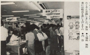
盛況でとても好評だった昨年の消費生活展

最近、私たちが毎日の暮らしの中で使っているプラスチック製品、ガラス製品、金属製品、繊維製品、化学製品の増加は、地球環境問題の深刻化を招いています。地球環境問題の深刻化を招いています。地球環境問題の深刻化を招いています。 ●内容 ●粗品 無料 ●会場 志保パーキング ●日時 十月二十一日(日)午後二時～午後五時