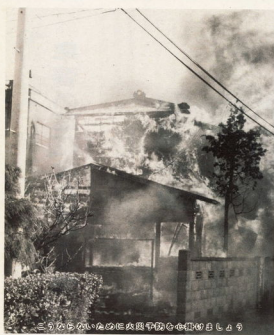
三つがらみの消防団が中心となり、平成元年の火災発生状況

救急車が運ばれた患者の病状の程度 救急車が運ばれた患者の病状の程度 救急車が運ばれた患者の病状の程度