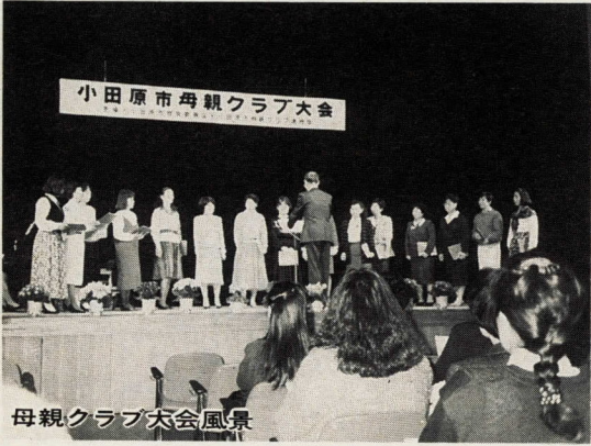
母親クラブ大会風景

そして、そのためには母親自身が自分自身を見つめ直し、さまざまな問題について問題意識を持つようになることが大切であると考えています。