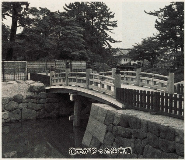
復元が完了した住吉橋

昭和五十八年から始まった分の修景もできて、江戸時代の丸中堀の整備事業も、平成の姿が次第にみえつつある。今年度は、八月から九月に