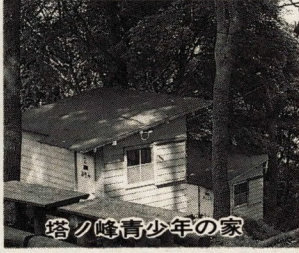
青少年関係団体の育成と連携強化

育成活動の効果をも高めるために、各団体に情報を提供し、技術的援助を行います。 ◆青少年の対外交流の推進 ◆青少年の非行防止活動の充実 ◆青少年非行防止活動の充実 ◆青少年非行防止活動の充実 ◆青少年非行防止活動の充実