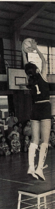
※写真と本文とは関係ありません