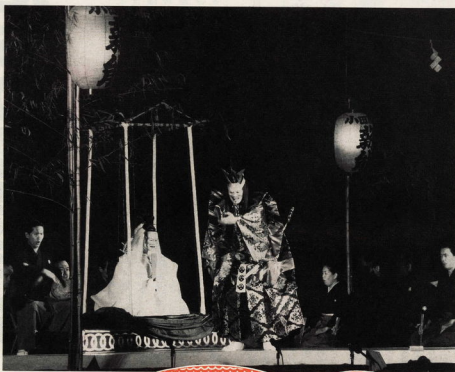
九月十七日、天守閣広場をむかひ、能「北條」が演じられた。

れ、その後上演されなくなっていた幻の能です。これを昭和六十一年の能楽師世承(元)が復元、形作りを行い、小田原城四百周年記念事業として復活上演されたもので、舞台わきのかりの間に照らされ、天守閣を背景に幻想的に演じられる能に、千人超り観客が見入っていました。