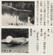
大賞「風の中で」 優秀賞 『Smash IV』

小田原城外彫刻展で、大賞。『風の中で』西澤康彦作。大賞。『風の中で』西澤康彦作。大賞。『風の中で』西澤康彦作。