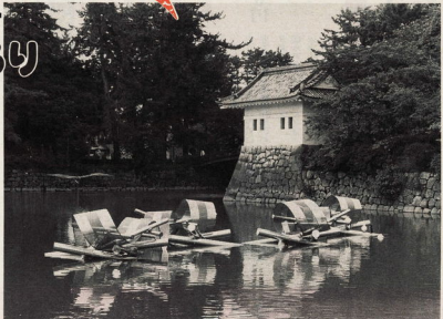
隣接をバックにお堀に浮かぶ作品

まじりの中の野外彫刻の任の方を探る「小田原城外彫刻展」が、七月七日から開催されました。 彫刻は、全国各地の作家から応募のあつた多勢の作品のうち二十点が、城址公園の一の丸と馬屋曲線の広場を中心に、お堀や雲龍木門前付近までを会場として展示されています。 お堀の中にスチール製の作品を浮かべたり、材料もあつち木のできる「文筆」(コトコト)な作りかたの「知」など、個性豊かな作品がずらりお目見えます。 秋だけなの「日」野外彫刻展で長雨と屋上の香りを是非お楽しみください。会期は十一月十五日(日)まで。