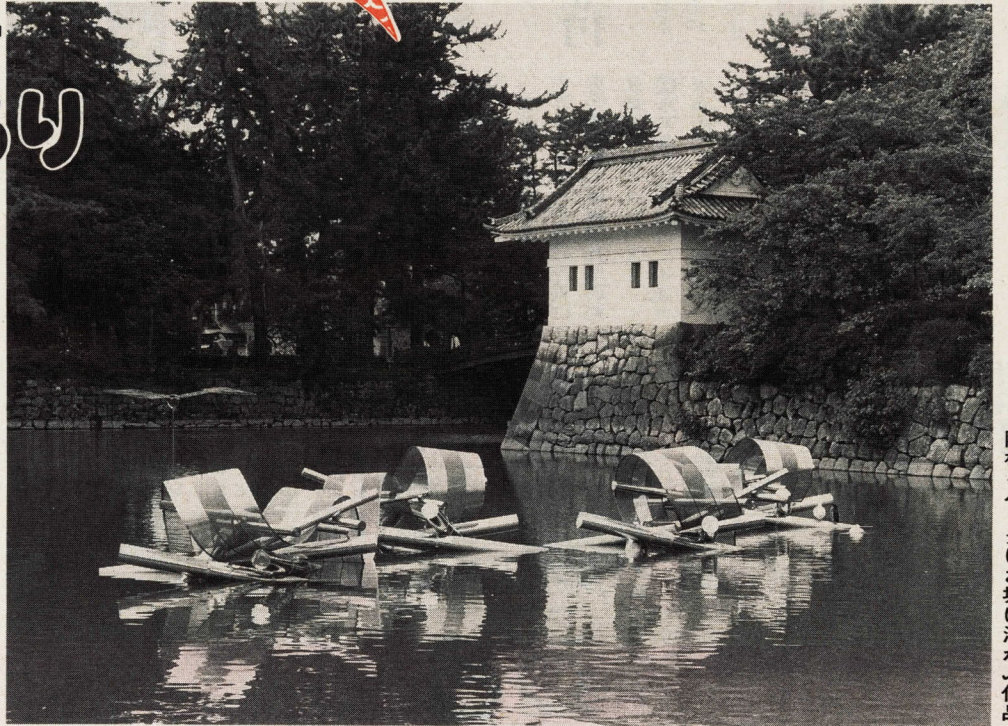
隅櫓をバックにお堀に浮かぶ作品

まちづくりの中の野外彫刻の在り方を探る小田原城野外彫刻展が、今月七日から開幕しました。彫刻は、全国各地の作家から応募のあった多数の作品のうち二十点が、城址公園の二の丸と馬屋曲輪の広場を中心に、お堀や堂盤木門前付近までを会場に展示されています。お堀の中にステンレス製の作品を浮かべたり、材料も石あり木ありでさまざま。多彩でユニークな作品がずらりと並んでいます。秋だけなわの一日、野外彫刻展で芸術と歴史の香りを是非お楽しみください。会期は十一月二十五日までです。