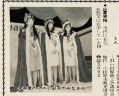
今年度のミス小田原のみなさん

開票速報はくらしのテレフォンガイドで。開票速報はくらしのテレフォンガイドで。 ●期日 三月二十一日(金) ●集合 解散 小田原駅口 ●集合時間 午前七時三十分 ●解散時間 午後二時三十分 ●定員 五十人(定員を超過する場合は抽選となります) ●参加費 無料(昼食は別) ●申し込み 三月十六日(土)までに電話で三浦課へお申し込みください。 ●申し込み先 小田原市役所 広報課 ☎33-1263