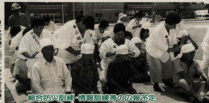
総合防災訓練・情報訓練等の広報予定

寝たきりのお年寄りの方へ 訪問入浴サービスの利用を さきんりのために、ご家庭に移動入浴車を運送する訪問入浴サービスを行っています。