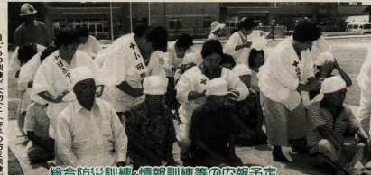
総合防災訓練・情報伝達等の広報予定