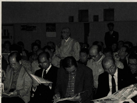
活発な意見が出られる市民集会

十月八日(土)市内各地で開かれていた市民集会では、将菜の小田原市に対する希望や地域づくりのアイデアなど、出席者から活発な意見が出されています。 市では、寄せられた意見を「おだわら21世紀」の「後期基本計画」に反映していきます。 今後の集会は、十一月十五日(土)上府中分館、十九日(火)国府東分館、二十日(水)小田原市会館、二十六日(火)小田原市役所の四回で隔週はいますが、午後七時から九時までは、