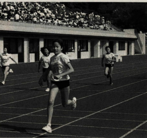
僕も私も一生懸命の競技

第五回小田原市小学校体育大会が十月二十日、城陸上競技場で開催され、全市小学校六年生男女約千四百人が一堂に集えられました。 早朝からの秋晴れの下、代表者による八百、千メートル競走や走高跳び、走幅跳びなど七種目も、全副を対戦したミニスタジアムやフットボールコートで行われ、体刀(けん道)と併せて楽しい交流が図られました。