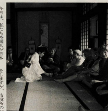
外国のしきたりに慣れるまでがひと苦労

外国人の見た小田原ってどんなまちか、という質問をよく聞かれます。小田原は、外国人の見た小田原ってこんなまちです。外国人の見た小田原ってこんなまちです。外国人の見た小田原ってこんなまちです。