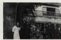
昭和十年、小田原に、帰った白秋をかこんで