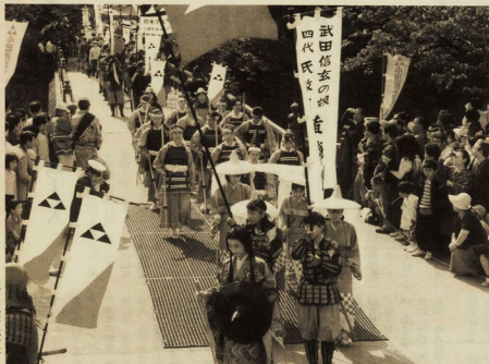
城内高松女武者隊