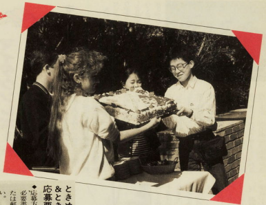
国旗をおしらったケキに 両国の親善大使も大喜び。 (1991年暮オーストラリアにて)