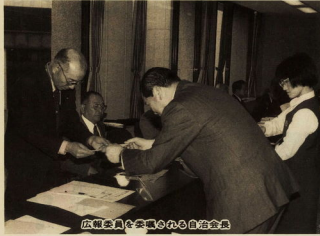
広報委員会委員と自治会長

今年度の自治会長二百四十七人が決まりました。自治会長の方は、福増の増や福の発展に力を尽くしていただきます。また、市から推薦職員と広報委員を委嘱し、市民と市とのパイプ役として地域の発展を市に促したり、市からのお知らせをみなさんにお伝えしたりするほか、「広報おだわら」の配布をはじめとする様々な行政事務に携わっていただきます。自治会長会の役員、みさきの地区の自治会長の方です。 (四日)日現在、敬称略。大は漢字、広は振仮名