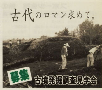
古墳発掘調査見学会 古墳発掘調査見学会のメンバーが、古墳の発掘現場で作業を行っている様子。当日は集合場所から徒歩で現場まで行き、現地で開催される見学会に参加する予定です。見学会は9月15日(日)午後2時30分集合です。