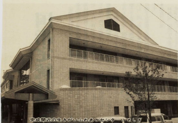
和歌山府下の生かすあいのふれあいセンター(仮称)

9月15日の敬老の日からの老人福祉週間、市内の各地域ではいろいろな敬老行事が行われます。また、この10月1日には高齢者の健康づくり、就労、生涯学習の場である「生きがいふれあいセンター いそぎ」が酒匂にオープンしますので、今回はその概要をお知らせします。この機会に市民のみならず人生即年時代の生活設計、学び、健康づくり、さらにもしもの時の準備のことなどを考えていただきたいと思います。そして、市民、民間、行政が一体となって、ゆとりと生きがいのある街、人間味あふれる社会の実現を目指していきます。